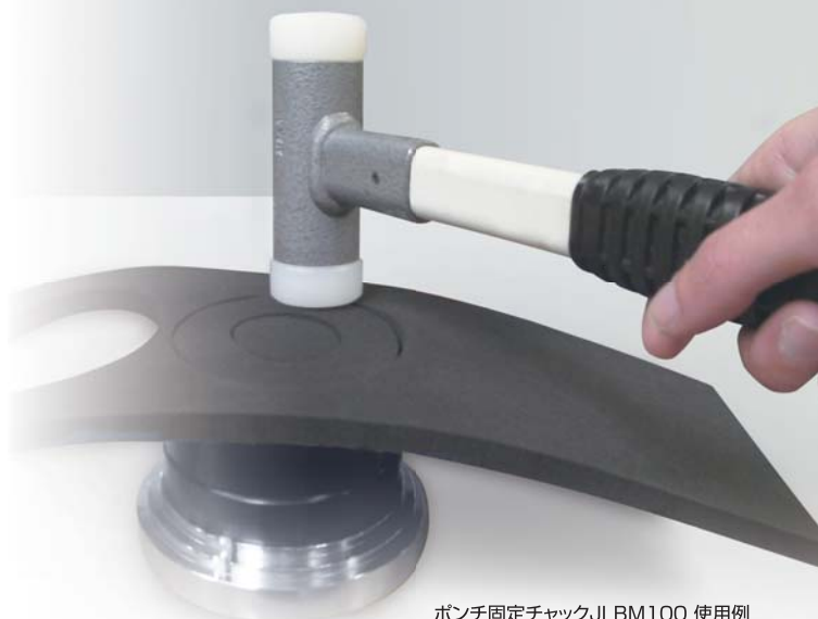
ポンチ固定チャックJLBM100 使用例